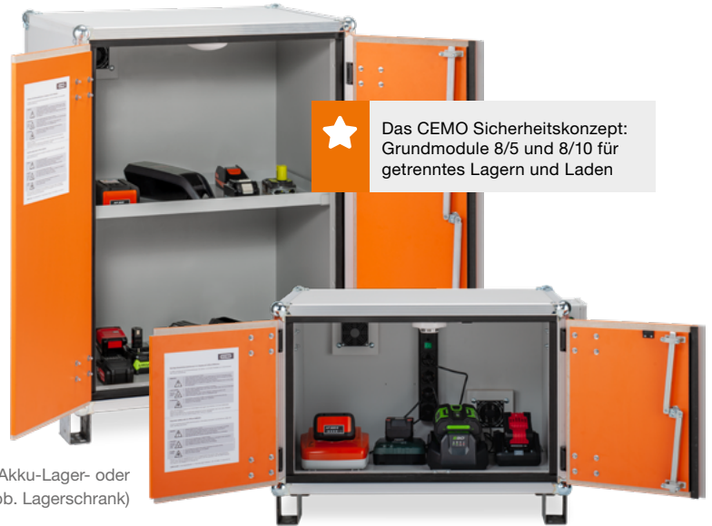
Modell 8/10 Akku-Lager- oder Ladeschrank (Abb. Lagerschrank)